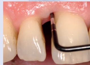
Sondierungstiefe Zahn 11 distovestibular