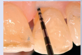
Sondierungstiefe Zahn 21 mesiopalatal