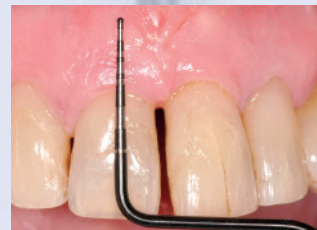
Breite der attached Gingiva