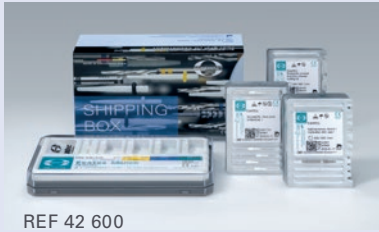
REF 42 600

*Die Standard Sets und die Test Sets werden in einer SHIPPING BOX geliefert. Inhalt siehe Preisliste.